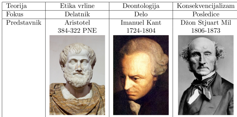
Tabela 1: Pregled teorija etike i vrednosti koje zastupaju